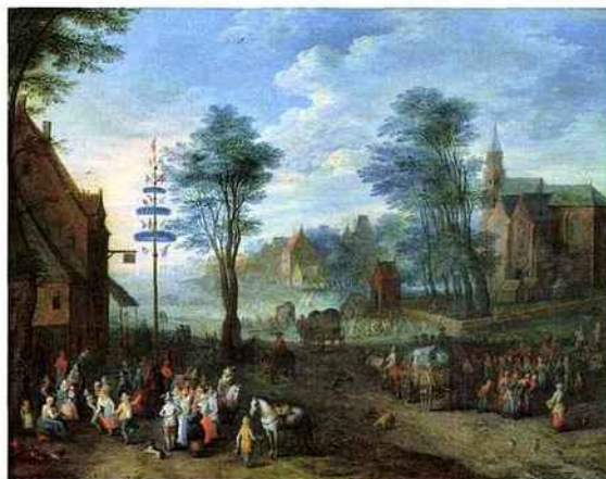
Joseph van Bredael, Scène villageoise avec la danse de l'arbre de Mai . Signé du monogramme. Huile sur cuivre, 30,5 x 39 cm. Paris, galerie Florence de Voldère.

« Nocturne Rive Droite », le mercredi 3 juin 2015 de 17h à 23h dans le VIII e arrondissement de Paris. www.art-rivedroite.com